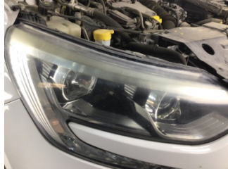
Farlar, Far, sağ > Solmuş