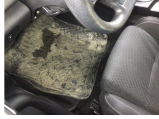
Taban, Taban halısı > Kirlenmiş