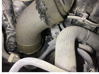
Motor, Turbo hortumları > Yağ Kaçağı