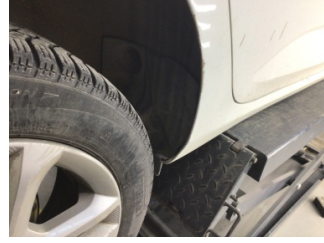
Çamurluk, sağ arka, Çamurluk ağzı > Pas