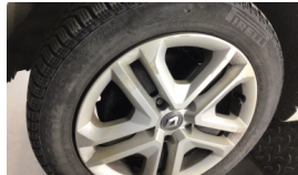
Jant kapağı seti > Çizik