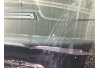
Camlar, Ön cam > Taş Vuruğu