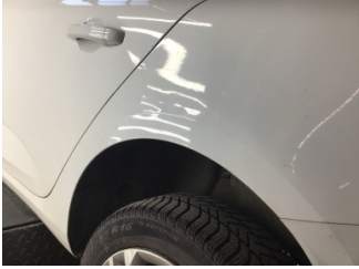
Çamurluk, sol arka, Çamurluk, sol arka > Hasarlı