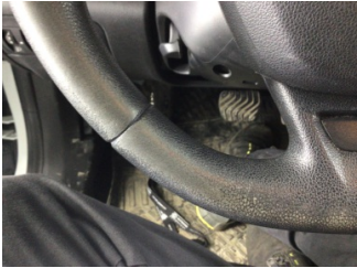
Direksiyon sistemi, Direksiyon simidi > Deforme Olmuş