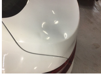
Bagaj kapağı/kapısı, Bagaj kapısı > Ezik