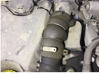
Motor, Turbo hortumları > Yağ Kaçağı