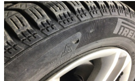
Lastik, ön > Hasarlı