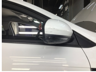
Dikiz aynası, sağ, Dış dikiz aynası > Çizik