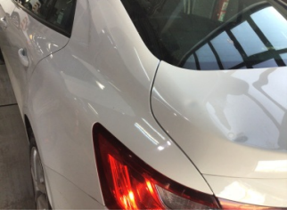
Çamurluk, sol arka, Çamurluk, sol arka > Ezik