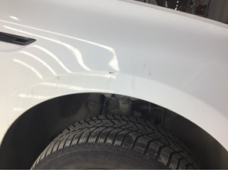
Çamurluk, sağ, Çamurluk ağızı > Çizik