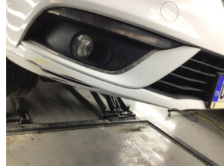
Tampon, ön, Ön tampon > Hasarlı