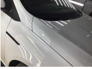
Motor kaputu, Motor kaputu > Noktasal Ezik

Sayfa: 10/12 Araç Çıkış Tarihi: 19.12.2024 16:17