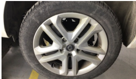
Jant kapağı seti > Çizik