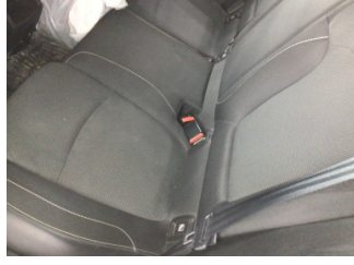
Koltuklar, arka, Arka koltuk > Kirlenmiş