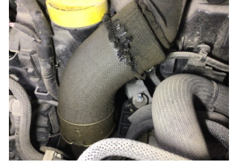
Motor, Turbo hortumları > Yağ Kaçağı