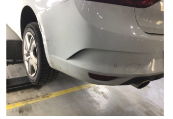
Tampon, arka, Arka tampon > Hasarlı