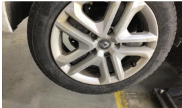
Jant kapağı seti > Çizik