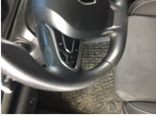
Direksiyon sistemi, Direksiyon simidi > Deforme Olmuş

Sayfa: 10/11 Araç Çıkış Tarihi: 23.12.2024 16:01