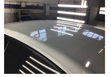
Tavan, Tavan > Ezik