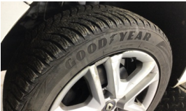
Jant kapağı seti > Hasarlı