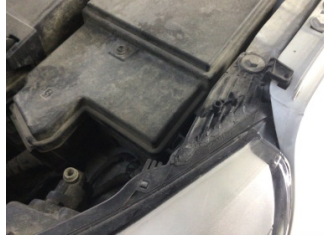
Farlar, Far, sol > Standart Dışı Onarım