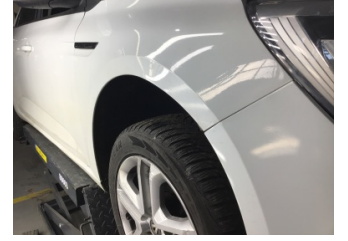
Çamurluk, sağ, Çamurluk, sağ > Ayarsız