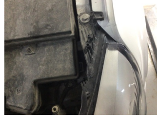
Farlar, Far, sol > Hasarlı