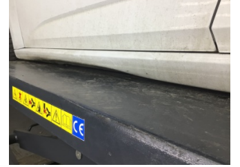
Marşbiyel, sol, Marşbiyel, sol > Hasarlı