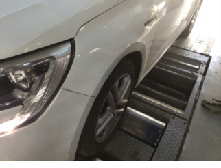
Çamurluk, sol, Çamurluk, sol > Ezik