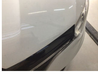
Motor kaputu, Motor kaputu > Ezik