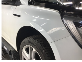
Çamurluk, sağ, Çamurluk, sağ > Ezik