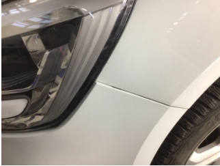
Tampon, ön, Ön tampon > Ayarsız