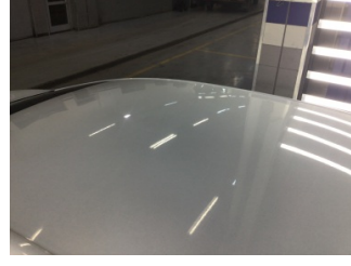
Tavan, Tavan > Ezik