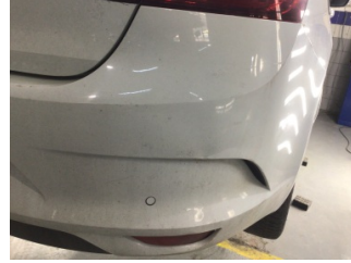
Tampon, arka, Arka tampon > Hasarlı