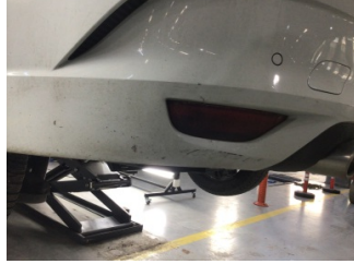
Tampon, arka, Arka tampon > Hasarlı