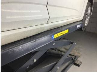
Marşbiyel, sağ, Marşbiyel, sağ > Hasarlı