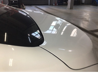
Bagaj kapağı/kapısı, Bagaj kapısı > Ezik