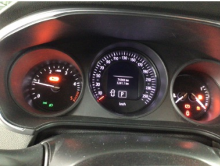
Motor, Bakım > Uyarı Lambası Yanıyor