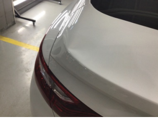
Motor kaputu, Motor kaputu > Ezik