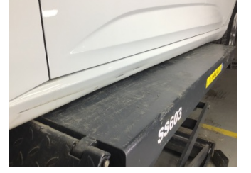
Marşbiyel, sol, Marşbiyel, sol > Ezik