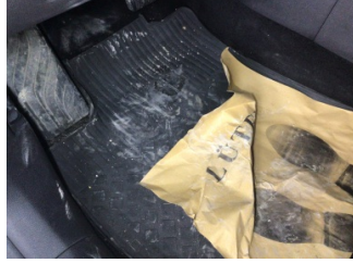
Taban, Paspaslar > Deforme Olmuş