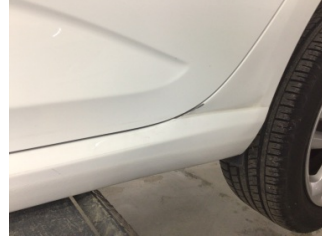
Çamurluk, sol arka, Çamurluk ağı > Ezik