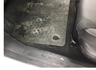
Taban, Paspaslar > Deforme Olmuş