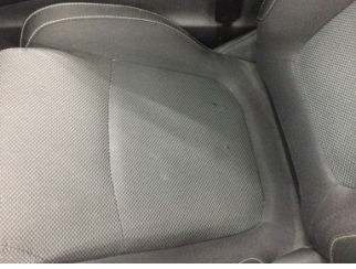
Koltuklar, ön, Koltuk, sol ön > Deforme Olmuş