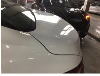
Bagaj kapağı/kapısı, Bagaj kapısı > Noktasal Ezik