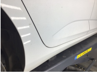
Kapı, sağ arka, Kapı, sağ arka > Noktasal Ezik