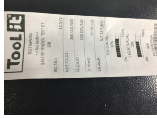
Elektrik donanımı/Pano, Akü > Test Sonucu