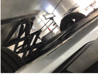
Tampon, ön, Ön tampon > Çizik