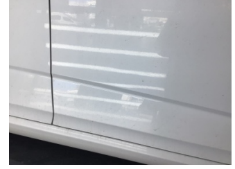
Kapı, sağ ön, Kapı, sağ ön > Noktasal Ezik