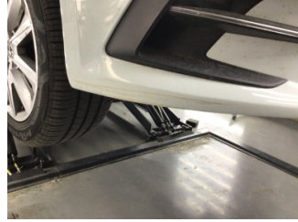
Tampon, ön, Ön tampon > Çizik