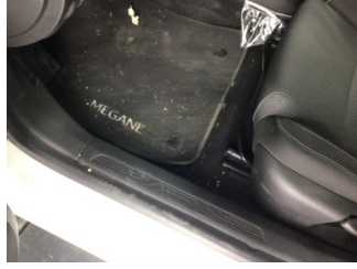
Taban, Taban halısı > Kirlenmiş