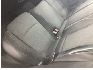
Koltuklar, arka, Arka koltuk > Kirlenmiş