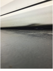
Marşbiyel, sol, Marşbiyel, sol > Ezik