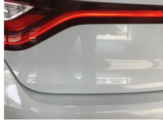
Bagaj kapağı/kapısı, Bagaj kapısı > Çizik