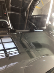
Camlar, Ön cam > Taş İzi