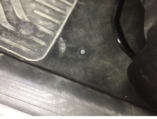
Taban, Taban halısı > Yakıcı Madde Ile Zarar Görmüş