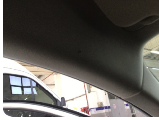
Döşemeler/Kapaklar, Tavan döşemesi > Yakıcı Madde Ile Zarar Görmüş