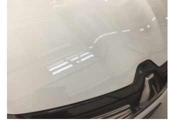
Motor kaputu, Motor kaputu > Taş İzi