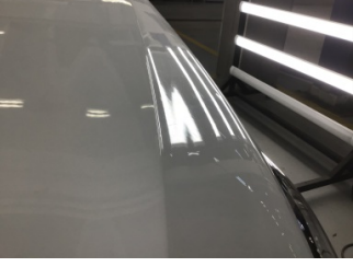
Motor kaputu, Motor kaputu > Ezik