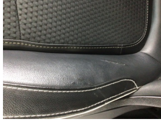
Koltuklar, ön, Koltuk, sol ön > Deforme Olmuş