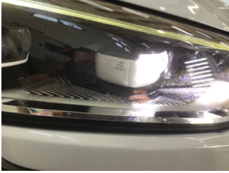
Farlar, Far camı, sağ > Çizik