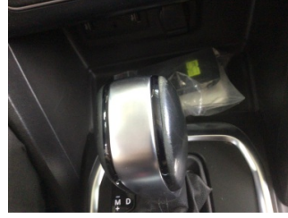
Şanzıman, Vites topuzu > Deforme Olmuş