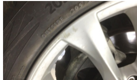
Jant, sol ön > Çizik