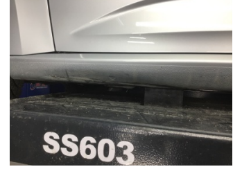
Marşbiyel, sol, Marşbiyel, sol > Ezik