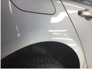
Çamurluk, sağ, Çamurluk ağızı > Ezik