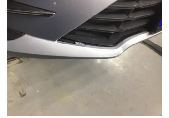
Tampon, ön, Ön tampon ızgarası > Hasarlı