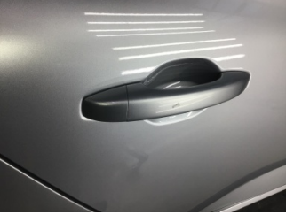
Kapı, sağ arka, Kapı kolu, dış > Çizik