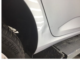
Çamurluk, sağ, Çamurluk ağızı > Ezik