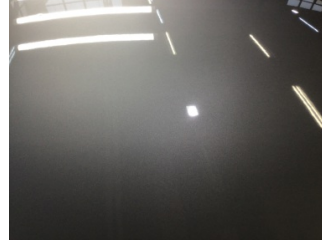
Tavan, Tavan > Yakıcı Madde ile Zarar Görmüş