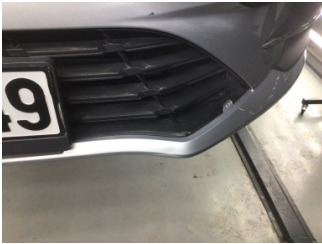
Tampon, ön, Ön tampon ızgarası > Hasarlı