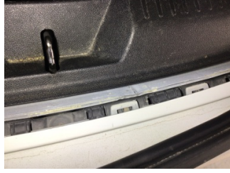
Arka bölüm, Arka sac/panel > Standart Dışı Onarım