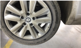
Jant kapağı seti > Hasarlı