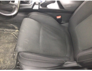
Koltuklar, ön, Koltuk, sol ön > Kirlenmiş