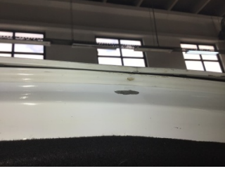
Bagaj kapağı/kapısı, Bagaj kapısı > Standart Dışı Onarım