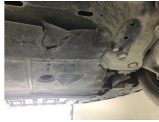
Motor, Alt muhafaza > Hasarlı