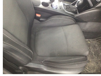
Koltuklar, ön, Koltuk, sağ ön > Kirlenmiş