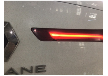
Arka lambalar, Arka lambalar, sağ > Hasarlı