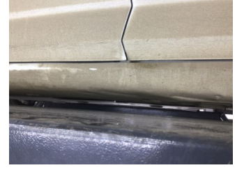
Marşbiyel, sol, Marşbiyel, sol > Ezik