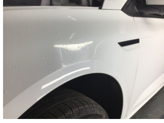
Çamurluk, sol, Çamurluk, sol > Küçük Çizik