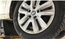
Jant, sağ ön > Hasarlı