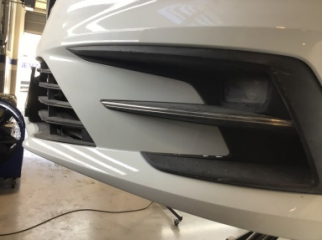
Tampon, ön, Ön tampon ızgarası > Çizik