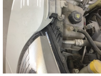
Farlar, Far bağlantı ayağı, sağ > Hasarlı