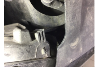
Farlar, Far bağlantı ayağı, sağ > Hasarlı