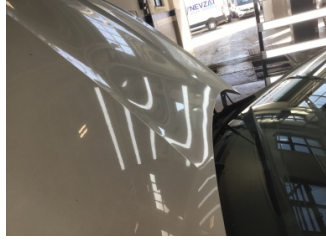
Motor kaputu, Motor kaputu > Noktasal Ezik