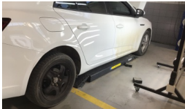
Jant kapağı seti > Eksik