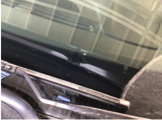
Camlar, Ön cam > Hasarlı