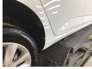
Çamurluk, sağ arka, Çamurluk ağı > Ezik