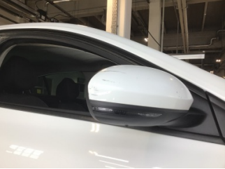
Dikiz aynası, sağ, Dış dikiz aynası > Çizik