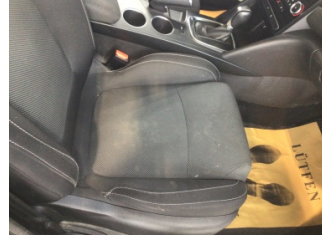
Koltuklar, ön, Koltuk, sağ ön > Kirlenmiş