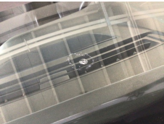
Camlar, Ön cam > Taş Vuruğu