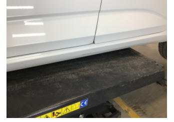
Kapı, sol ön, Kapı, sol ön > Ezik