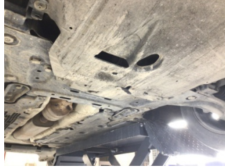
Motor, Alt muhafaza > Hasarlı