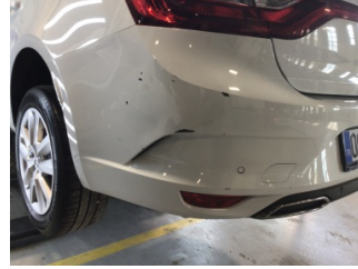
Tampon, arka, Arka tampon > Hasarlı