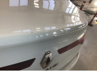
Bagaj kapağı/kapısı, Bagaj kapısı > Ezik