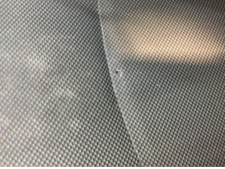
Koltuklar, ön, Koltuk, sol ön > Yakıcı Madde ile Zarar Görmüş