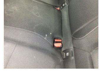
Koltuklar, arka, Arka koltuk > Yakıcı Madde ile Zarar Görmüş