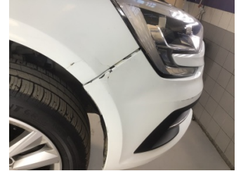
Tampon, ön, Ön tampon > Ayarsız