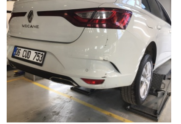
Tampon, arka, Arka tampon > Hasarlı