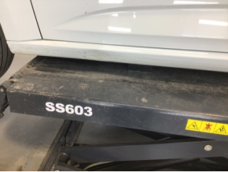
Marşbiyel, sol, Marşbiyel, sol > Hasarlı