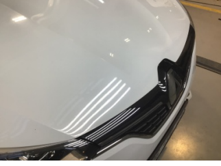
Motor kaputu, Motor kaputu > Taş izi

Sayfa: 10/12 Araç Çıkış Tarihi: 05.03.2025 10:43