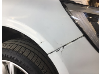
Çamurluk, sağ, Çamurluk, sağ > Hasarlı