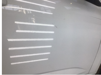
Kapı, sağ ön, Kapı, sağ ön > Çizik