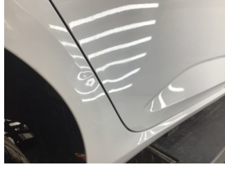
Kapı, sağ arka, Kapı, sağ arka > Ezik