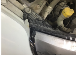
Farlar, Far bağlantı ayağı, sağ > Hasarlı