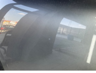
Kapı, sağ arka, Kapı, sağ arka > Noktasal Ezik