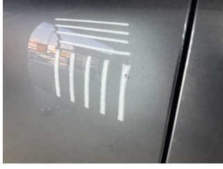
Kapı, sağ ön, Kapı, sağ ön > Noktasal Ezik