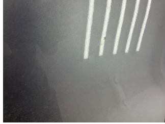
Kapı, sol ön, Kapı, sol ön > Çizik