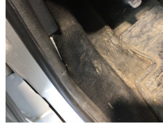
Taban, Taban halısı > Deforme Olmuş