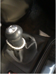
Şanzıman, Vites körüğü > Hasarlı