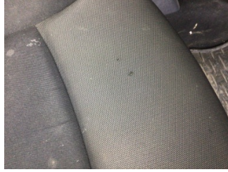
Koltuklar, ön, Koltuk, sağ ön > Deforme Olmuş