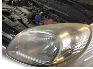
Farlar, Far, sol > Solmuş