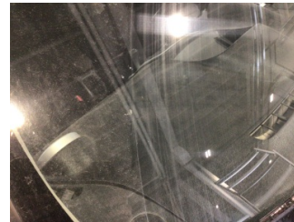
Camlar, Ön cam > Taş İzi