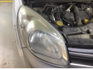
Farlar, Far, sağ > Solmuş

Sayfa: 10/12 Araç Çıkış Tarihi: 12.02.2025 17:18