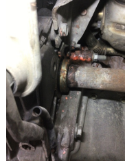
Motorsoğutması, Soğutma sıvısı > Sızdırıyor