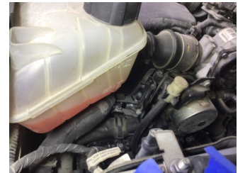
Motorsuğutması, Soğutma sıvısı > Eksik