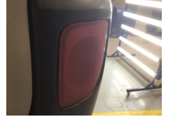
Tampon, arka, Reflektör, sağ > Hasarlı