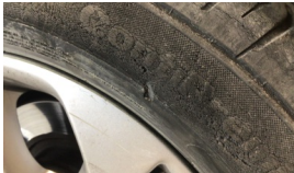
Lastik, arka > Hasarlı