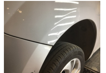
Çamurluk, sol, Çamurluk, sol > Standart Dışı Onarım