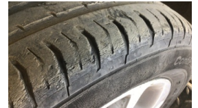
Lastik, ön > Deforme Olmuş