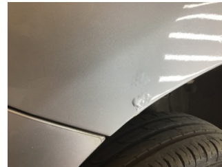
Çamurluk, sol, Çamurluk, sol > Hasarlı