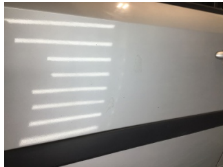
Kapı, sol ön, Kapı, sol ön > Boyası Atmış