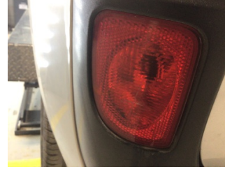
Tampon, arka, Reflektör, sol > Hasarlı