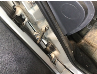
Kapı, sol ön, Kapı gergisi > Ses Yapıyor