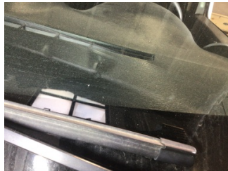
Camlar, Ön cam > Taş İzi