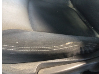
Koltuklar, ön, Koltuk, sol ön > Deforme Olmuş