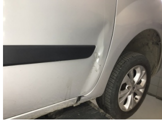
Kapı, sağ ön, Kapı, sağ ön > Hasarlı