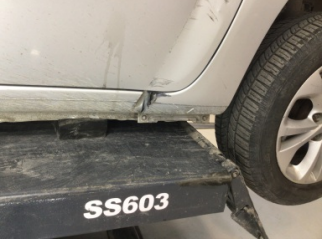
Çamurluk, sağ, Çamurluk, sağ > Hasarlı