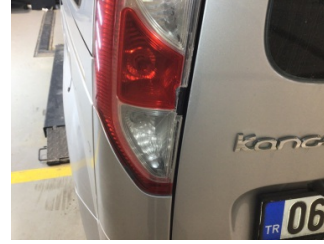
Arka lambalar, Arka lambalar, sol > Hasarlı