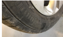
Lastik, ön > Deforme Olmuş