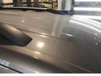
Tavan, Tavan > Yakıcı Madde İle Zarar Görmüş