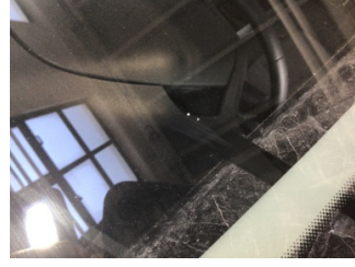
Camlar, Ön cam > Taş İzi