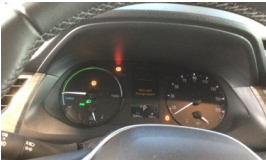
Tekerlek/Lastik > Uyarı Lambası Yanıyor