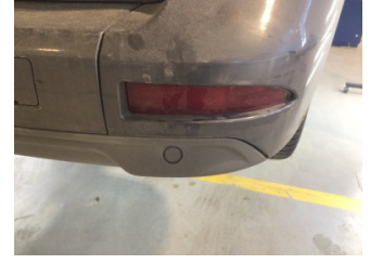
Tampon, arka, Reflektör, sağ > Hasarlı