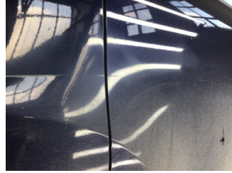
Kapı, sağ arka, Kapı, sağ arka > Çizik