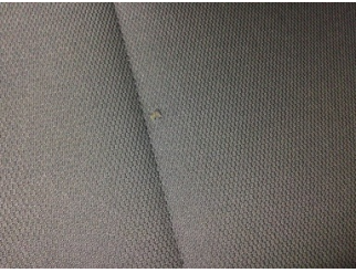
Koltuklar, ön, Koltuk, sol ön > Yakıcı Madde ile Zarar Görmüş