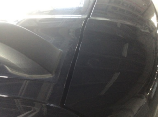
Bagaj kapağı/kapısı, Bagaj kapısı > Yakıcı Madde ile Zarar Görmüş