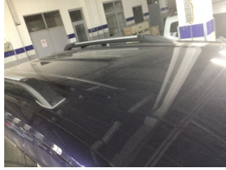
Tavan, Tavan > Yakıcı Madde ile Zarar Görmüş