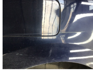
Çamurluk, sağ arka, Çamurluk, sağ arka > Çizik