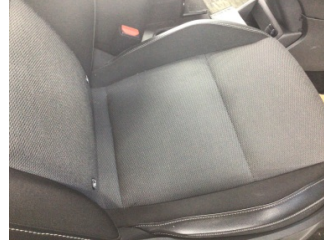
Koltuklar, ön, Koltuk, sağ ön > Kirlenmiş