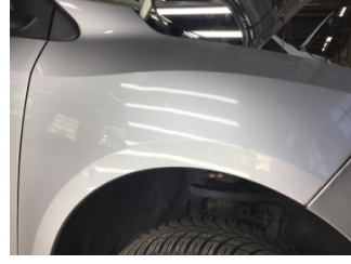
Çamurluk, sağ, Çamurluk, sağ > Ezik