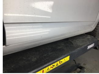
Kapı, sağ ön, Kapı bandı > Çizik