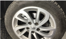
Jant, sağ ön > Çizik