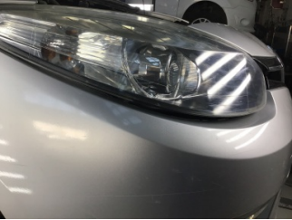
Tampon, ön, Ön tampon > Ayarsız