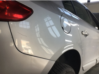
Çamurluk, sağ arka, Çamurluk, sağ arka > Çizik