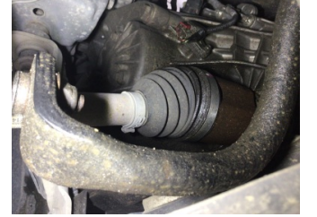
Şanzıman, Şanzıman > Yağ Kaçağı