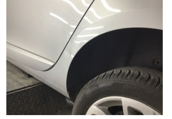
Çamurluk, sol arka, Çamurluk, sol arka > Ezik