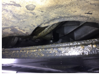
Şanzıman, Şanzıman > Yağ Kaçağı