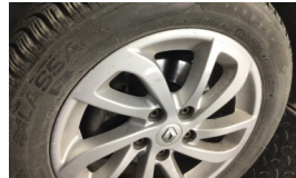
Jant, sol ön > Çizik