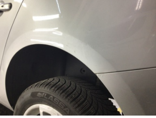
Çamurluk, sol arka, Çamurluk, sol arka > Ezik