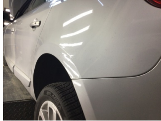
Çamurluk, sol arka, Çamurluk, sol arka > Standart Dışı Onarım