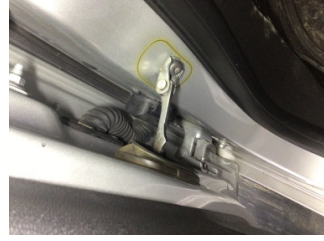
Kapı, sol ön, Kapı gergisi > Ses Yapıyor