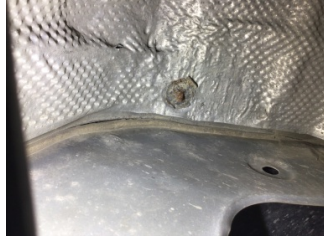
Arka bölüm, Bagaj havuzu > Ezik