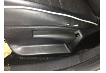
Koltuklar, ön, Koltuk, sol ön > Deforme Olmuş