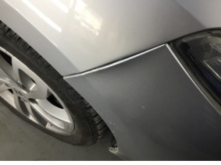
Tampon, ön, Bağlantı ayağı > Hasarlı

Sayfa: 9/10 Araç Çıkış Tarihi: 26.12.2024 14:34