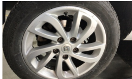
Jant, sağ arka > Çizik