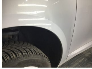
Çamurluk, sol, Çamurluk, sol > Ezik