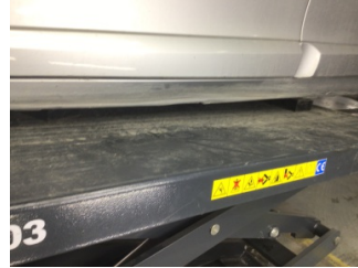
Marşbiyel, sol, Marşbiyel, sol > Hasarlı