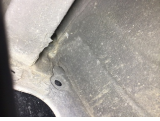
Arka bölüm, Bagaj havuzu > Ezik