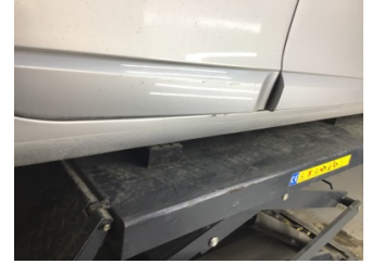
Kapı, sağ arka, Kapı bandı > Çizik