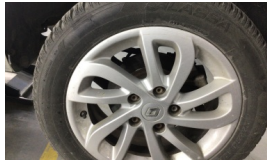
Jant, sol arka > Çizik