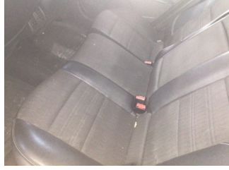
Koltuklar, arka, Arka koltuk > Kirlenmiş