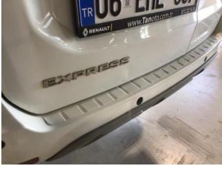
Bagaj kapağı/kapısı, Bagaj kapısı > Ezik