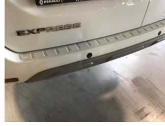
Tampon, arka, Arka tampon > Ezik