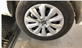
Jant kapağı seti > Çizik