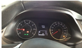
Tekerlek/Lastik > Uyarı Lambası Yanıyor