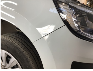
Çamurluk, sağ, Çamurluk, sağ > Küçük Çizik