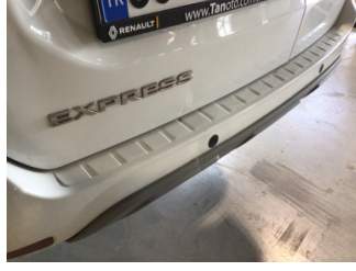
Bagaj kapağı/kapısı, Bagaj kapısı > Ezik