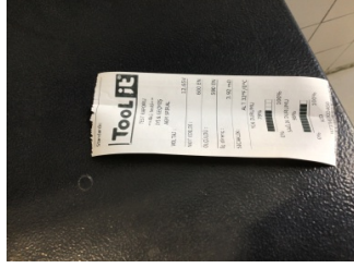
Elektrik donanımı/Pano, Akü > Test Sonucu