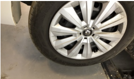
Jant kapağı seti > Çizik