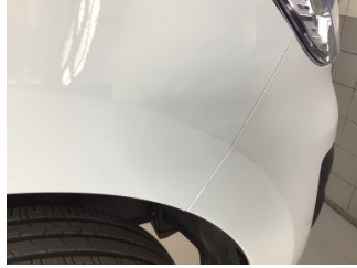
Çamurluk, sağ, Çamurluk, sağ > Çizik