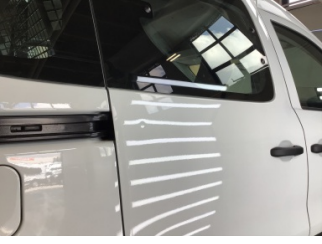
Kapı, sağ arka, Kapı, sağ arka > Noktasal Ezik