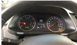
Tekerlek/Lastik > Uyarı Lambası Yanıyor