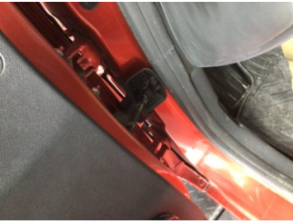
Kapı, sol ön, Kapı gergisi > Ses Yapıyor