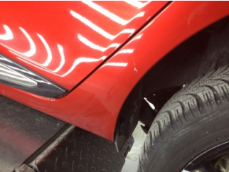
Çamurluk, sol arka, Çamurluk ağzı > Çizik