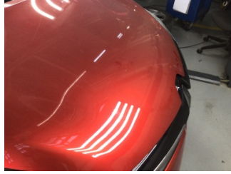
Motor kaputu, Motor kaputu > Yakıcı Madde Ile Zarar Görmüş