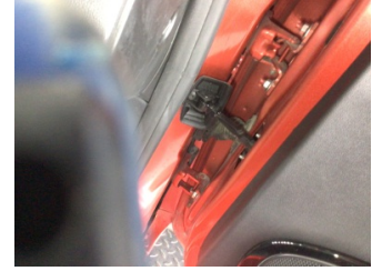
Kapı, sağ ön, Kapı gergisi > Ses Yapıyor