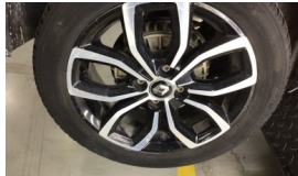
Jant, sağ arka > Çizik