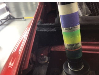
Motor, Silindir kapağı contası > Test Sonucu