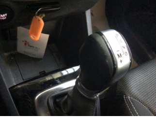
Şanzıman, Vites topuzu > Deforme Olmuş