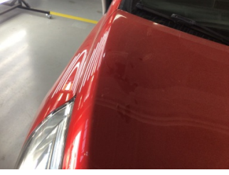
Motor kaputu, Motor kaputu > Ezik