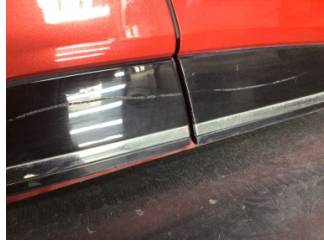
Kapı, sağ ön, Kapı bandı > Çizik