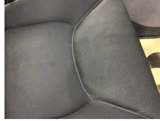
Koltuklar, ön, Koltuk, sağ ön > Yakıcı Madde Ile Zarar Görmüş