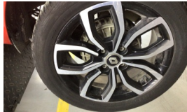
Jant, sol arka > Çizik