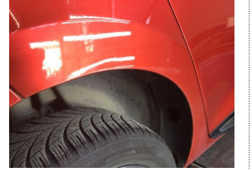
Çamurluk, sağ arka, Çamurluk, sağ arka > Çizik