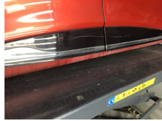
Kapı, sağ arka, Kapı bandı > Çizik