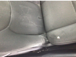
Koltuklar, ön, Koltuk, sol ön > Deforme Olmuş