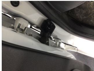
Kapı, sol ön, Kapı gergisi > Ses Yapıyor