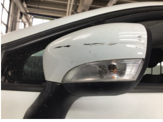
Dikiz aynası, sol, Sinyal lambası > Hasarlı