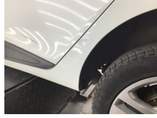
Çamurluk, sol arka, Çamurluk ağı > Ezik