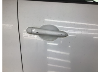
Kapı, sağ ön, Kapı kolu, dış > Çizik