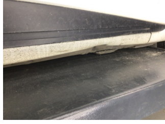
Marşbiyel, sağ, Marşbiyel, sağ > Hasarlı