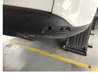
Tampon, arka, Reflektör, sağ > Sökülmüş-Yok