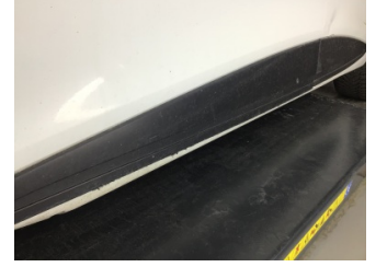
Kapı, sol ön, Kapı bandı > Hasarlı