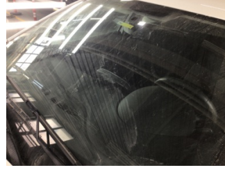
Camlar, Ön cam > Taş Vuruğu