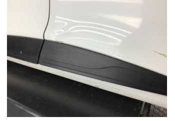
Kapı, sol arka, Kapı, sol arka > Hasarlı