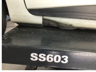
Marşbiyel, sol, Marşbiyel, sol > Hasarlı