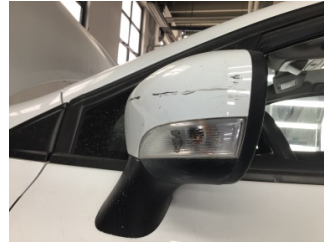
Dikiz aynası, sol, Dış dikiz aynası > Çizik