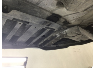
İlave parçalar, ön, Ön koruma demiri > Ezik