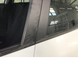
Kapı, sol ön, Kapı, sol ön > Ezik