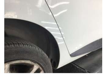
Çamurluk, sağ arka, Çamurluk, sağ arka > Çizik