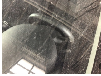
Camlar, Ön cam > Taş Vuruğu