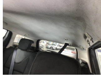
Döşemeler/Kapaklar, Tavan döşemesi > Kirlenmiş