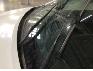
Cam yıkama/silme sistemi, Silecek sistemi > Çalışmıyor