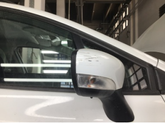
Dikiz aynası, sağ, Dış dikiz aynası > Çizik