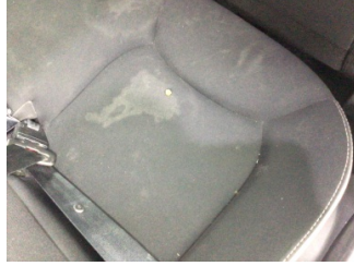
Koltuklar, arka, Arka koltuk > Yakıcı Madde ile Zarar Görmüş