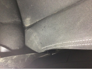
Koltuklar, ön, Koltuk, sağ ön > Deforme Olmuş