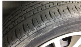
Lastik, ön > Deforme Olmuş