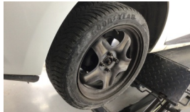
Jant kapağı seti > Eksik