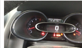
Tekerlek/Lastik > Uyarı Lambası Yanıyor