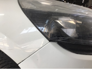
Farlar, Far, sağ > Çizik