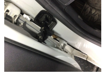
Kapı, sol ön, Kapı gergisi > Ses Yapıyor