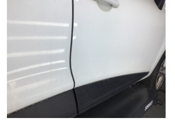
Kapı, sağ ön, Kapı, sağ ön > Noktasal Ezik