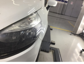
Çamurluk, sol, Çamurluk, sol > Ezik