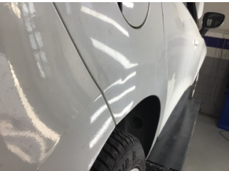
Çamurluk, sağ arka, Çamurluk, sağ arka > Noktasal Ezik