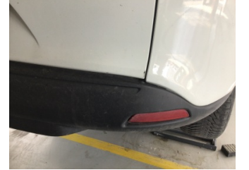
Bagaj kapağı/kapısı, Bagaj kapısı > Çizik