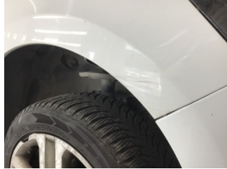
Çamurluk, sağ, Çamurluk, sağ > Çizik