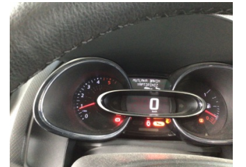
Motor, Bakım > Uyarı Lambası Yanıyor