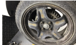
Jant kapağı seti > Eksik