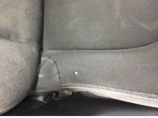
Koltuklar, ön, Koltuk, sağ ön > Yakıcı Madde Ile Zarar Görmüş