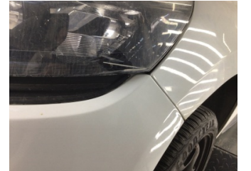
Farlar, Far, sol > Çizik