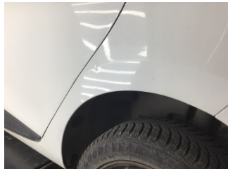
Çamurluk, sol arka, Çamurluk, sol arka > Noktasal Ezik