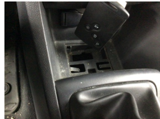
Dokümantasyon ve Ekipmanlar, OBD > Hasarlı