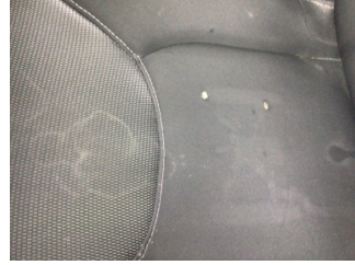
Koltuklar, ön, Koltuk, sol ön > Yakıcı Madde Ile Zarar Görmüş