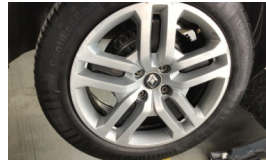
Jant kapağı seti > Hasarlı