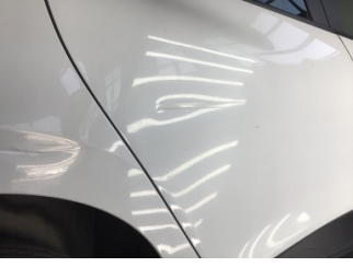
Kapı, sağ arka, Kapı, sağ arka > Ezik