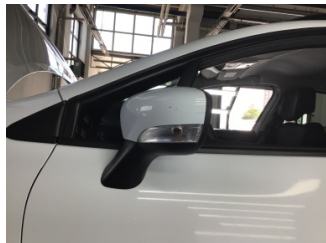
Dikiz aynası, sol, Dış dikiz aynası > Çizik