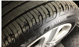
Lastik, ön > Deforme Olmuş