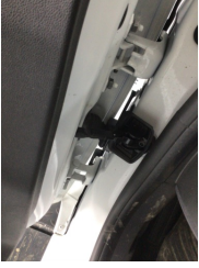
Kapı, sol ön, Kapı gergisi > Ses Yapıyor