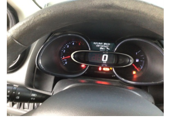
Motor, Bakım > Uyarı Lambası Yanıyor