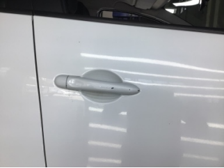
Kapı, sağ ön, Kapı kolu, dış > Çizik