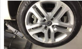
Jant kapağı seti > Hasarlı