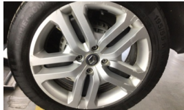
Jant kapağı seti > Hasarlı