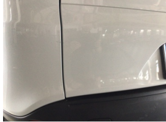
Bagaj kapağı/kapısı, Bagaj kapısı > Çizik