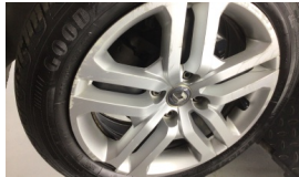
Jant kapağı seti > Hasarlı