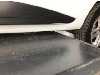
Marşbiyel, sol, Marşbiyel, sol > Çizik