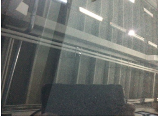
Camlar, Ön cam > Taş Vuruğu