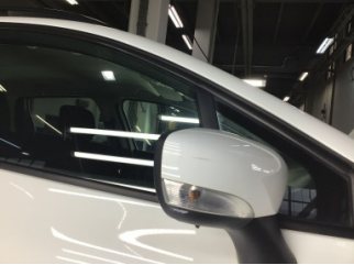
Dikiz aynası, sağ, Dış dikiz aynası > Çizik