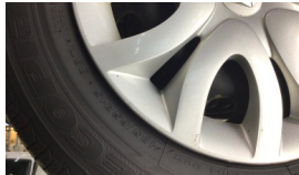
Jant kapağı seti > Çizik