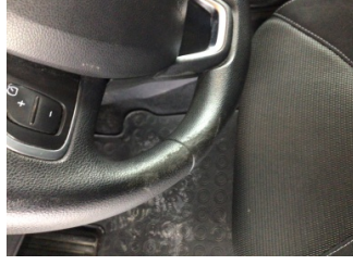
Direksiyon sistemi, Direksiyon simidi > Deforme Olmuş