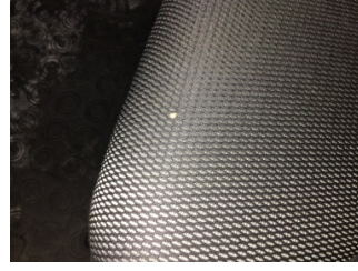
Koltuklar, ön, Koltuk, sol ön > Yakıcı Madde ile Zarar Görmüş