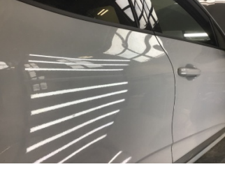
Kapı, sağ arka, Kapı, sağ arka > Noktasal Ezik