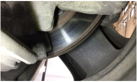
Fren Disk yüzeyi ön sağ > Aşınmış

Sapma yüzdeleri 1. ve 2. aks için %25 altında ve el freni için %50 altında olmalıdır.