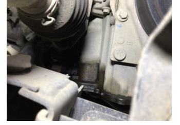
Motor, Yağ karteri contası > Yağ Kaçağı