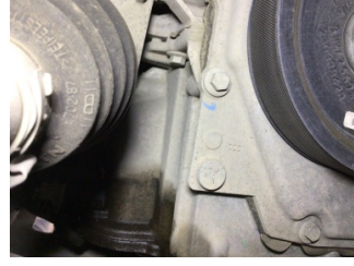
Motor, Yağ karteri contası > Yağ Kaçağı