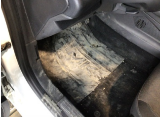
Taban, Paspaslar > Deforme Olmuş