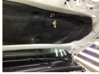
Motor kaputu, İzolasyon döşemesi > Deforme Olmuş