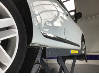
Marşbiyel, sağ, Marşbiyel, sağ > Ezik