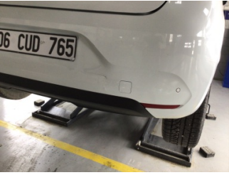
Tampon, arka, Arka tampon > Hasarlı