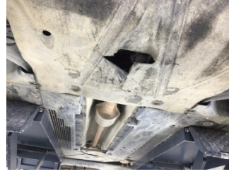
Motor, Alt muhafaza > Hasarlı