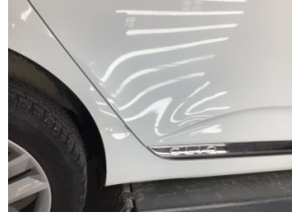
Kapı, sağ arka, Kapı, sağ arka > Ezik