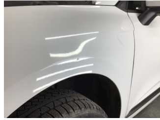
Çamurluk, sol, Çamurluk, sol > Noktasal Ezik