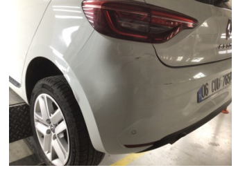
Tampon, arka, Arka tampon > Hasarlı