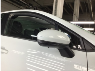
Dikiz aynası, sağ, Dış dikiz aynası > Çizik