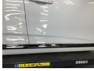
Kapı, sağ ön, Kapı, sağ ön > Ezik