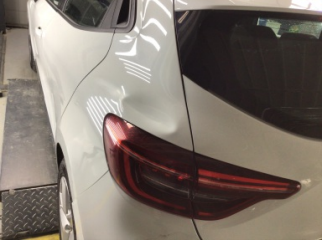
Çamurluk, sol arka, Çamurluk, sol arka > Hasarlı