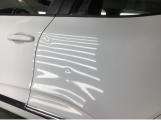
Kapı, sol arka, Kapı, sol arka > Ezik