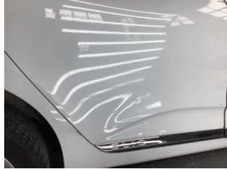
Kapı, sağ arka, Kapı, sağ arka > Çizik