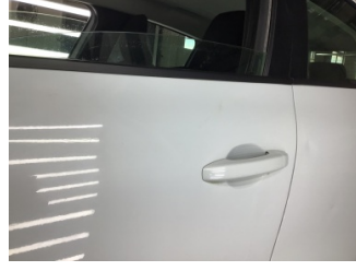
Kapı, sol ön, Kapı, sol ön > Ezik