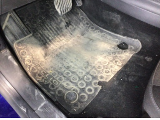
Taban, Paspaslar > Deforme Olmuş