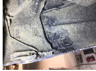
Tampon, ön, Ön tampon > Standart Dışı Onarım