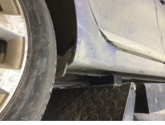
Marşbiyel, sağ, Marşbiyel, sağ > Ezik