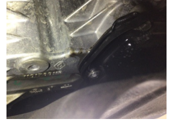
Motor, Yağ karteri contası > Yağ Kaçağı