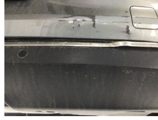
Tampon, arka, Spoiler > Ezik