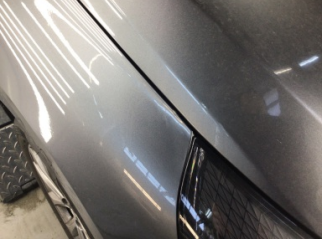
Çamurluk, sağ, Çamurluk, sağ > Ezik