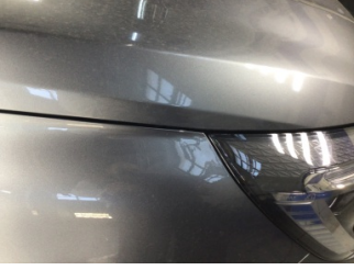
Çamurluk, sağ, Çamurluk, sağ > Standart Dışı Onarım