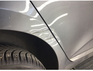
Çamurluk, sağ arka, Çamurluk ağzı > Hasarlı