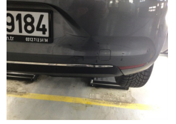
Tampon, arka, Arka tampon > Ezik