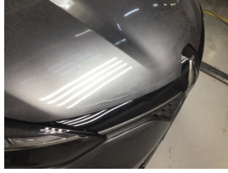
Motor kaputu, Motor kaputu > Standart Dışı Onarım