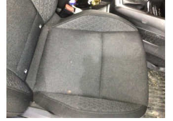
Koltuklar, ön, Koltuk, sağ ön > Kirlenmiş