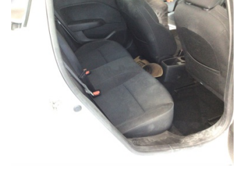
Döşemeler/Kapaklar, Döşemeler/Kapaklar > Kirlenmiş