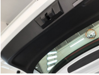
Döşemeler/Kapaklar, Döşemeler/Kapaklar > Kirlenmiş