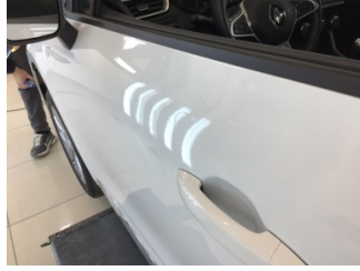
Kapı, sol ön, Kapı, sol ön > Noktasal Ezik