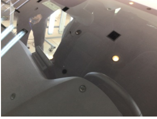
Camlar, Ön cam > Taş İzi