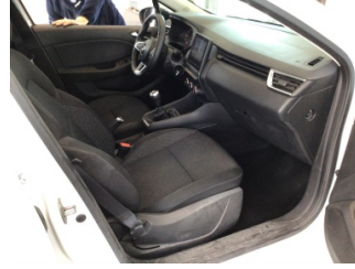
Döşemeler/Kapaklar, Döşemeler/Kapaklar > Kirlenmiş