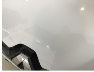
Motor kaputu, Motor kaputu > Taş İzi