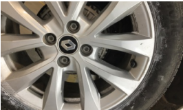
Jant, sağ arka > Çizik