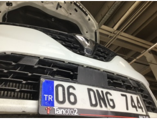
Tampon, ön, Ön tampon ızgarası > Ayarsız