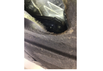
Motor, Yağ karteri > Yağ Kaçağı