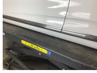
Marşbiyel, sol, Marşbiyel, sol > Ezik