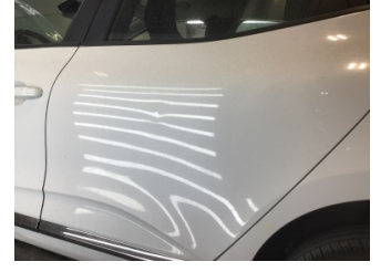
Kapı, sol arka, Kapı, sol arka > Ezik