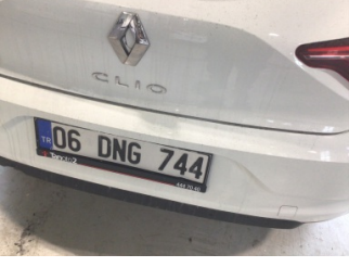
Tampon, arka, Arka tampon > Ezik