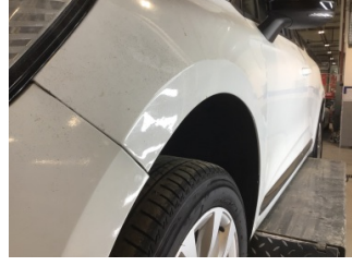
Çamurluk, sol, Çamurluk, sol > Standart Dışı Onarım