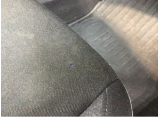
Koltuklar, ön, Koltuk döşemesi, sağ ön > Yakıcı Madde Ile Zarar Görmüş