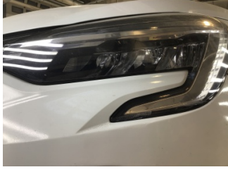
Farlar, Far camı, sol > Hasarlı