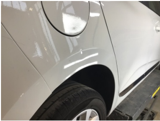
Çamurluk, sağ arka, Çamurluk ağzı > Noktasal Ezik