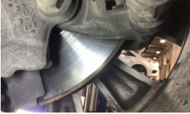
Fren Disk yüzeyi ön sol > Aşınmış

Sapma yüzdeleri 1. ve 2. aks için %25 altında ve el freni için %50 altında olmalıdır.