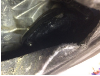
Motor, Yağ karteri contası > Yağ Kaçağı