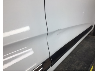
Kapı, sağ ön, Kapı, sağ ön > Standart Dışı Onarım