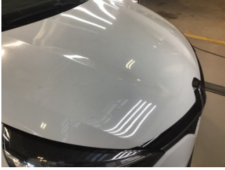
Motor kaputu, Motor kaputu > Taş lzi