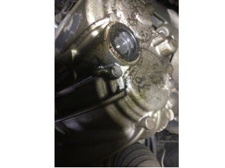
Şanzıman, Şanzıman > Yağ Kaçığı