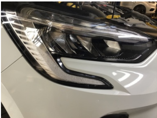
Farlar, Far, sağ > Deforme Olmuş