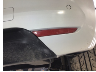
Tampon, arka, Reflektör, sağ > Hasarlı