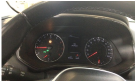
Tekerlek/Lastik > Uyarı Lambası Yanıyor