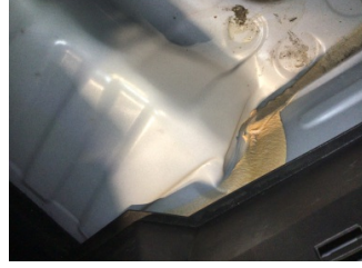
Arka bölüm, Bagaj havuzu > Hasarlı