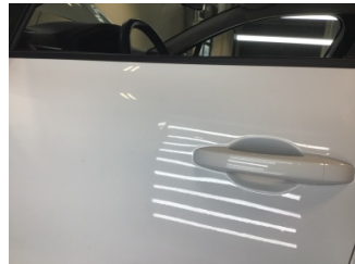
Kapı, sol ön, Kapı, sol ön > Noktasal Ezik