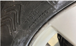
Lastik, sağ arka > Hasarlı