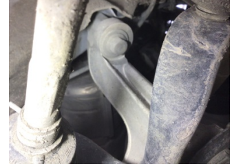
Motor, Triger zinciri kapağı > Yağ Kaçığı