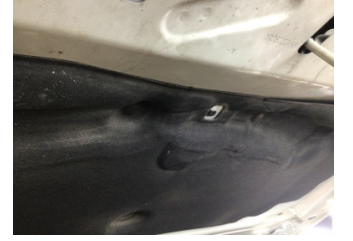
Motor kaputu, Dayama çubuğu/Amortisör > Hasarlı