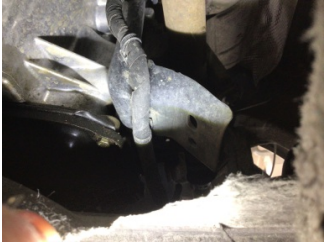
Motor, Yağ karteri contası > Yağ Kaçığı