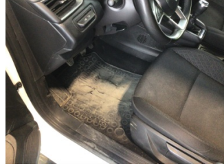
Taban, Paspaslar > Hasarlı