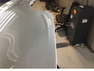
Motor kaputu, Motor kaputu > Ezik