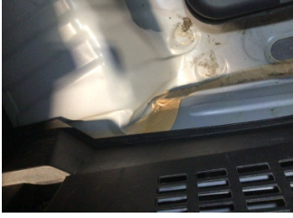
Arka bölüm, Arka sac/panel > Hasarlı

Sayfa: 10/11 Araç Çıkış Tarihi: 11.02.2025 09:47