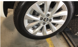
Jant, sağ arka > Çizik