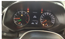
Tekerlek/Lastik > Uyarı Lambası Yanıyor