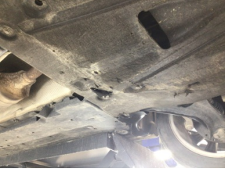
Motor, Alt muhafaza > Hasarlı