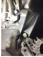
Motor, Triger zinciri kapağı > Yağ Kaçağı