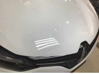
Motor kaputu, Motor kaputu > Taş Izı