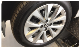
Jant, sol ön > Çizik