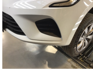
Tampon, ön, Ön tampon > Çizik