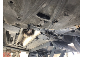
Motor, Alt muhafaza > Hasarlı