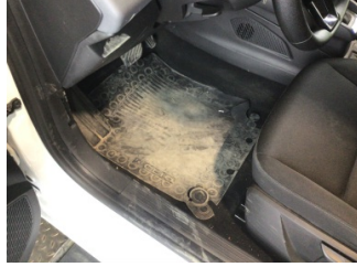
Taban, Taban halısı > Kirlenmiş