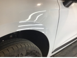
Çamurluk, sol, Çamurluk, sol > Noktasal Ezik