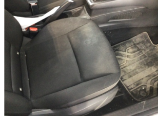
Koltuklar, ön, Koltuk, sağ ön > Kirlenmiş