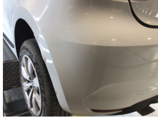
Tampon, arka, Arka tampon > Çizik