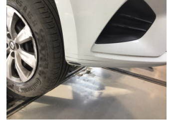
Tampon, ön, Ön tampon > Çizik