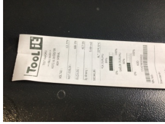
Elektrik donanımı/Pano, Akü > Test Sonucu