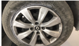
Jant kapağı seti > Çizik