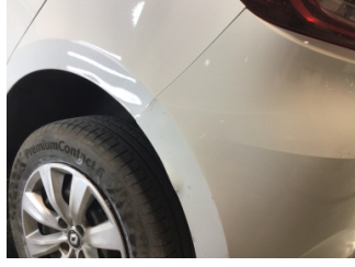
Çamurluk, sol arka, Çamurluk ağız > Ezik