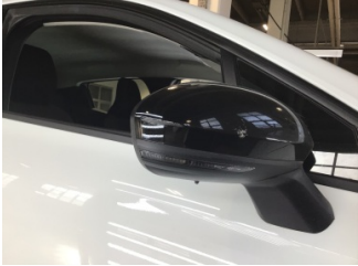
Dikiz aynası, sağ, Dış dikiz aynası > Çizik