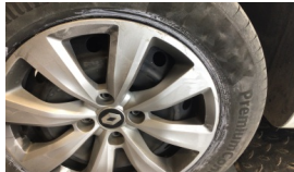
Jant kapağı seti > Çizik