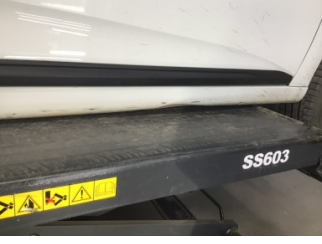
Marşbiyel, sağ, Marşbiyel, sağ > Ezik