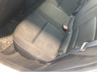
Koltuklar, arka, Arka koltuk > Kirlenmiş