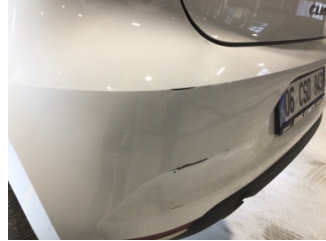
Tampon, arka, Arka tampon > Çizik