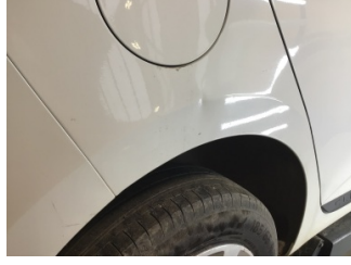
Çamurluk, sağ arka, Çamurluk, sağ arka > Ezik