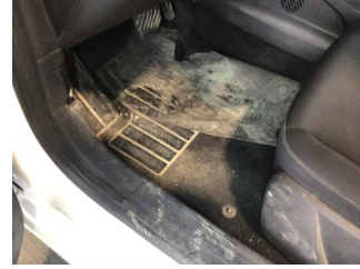
Taban, Paspaslar > Hasarlı