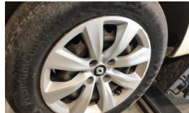
Jant kapağı seti > Çizik