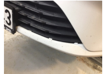
Tampon, ön, Ön tampon > Hasarlı