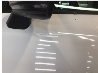
Kapı, sol ön, Kapı, sol ön > Noktasal Ezik