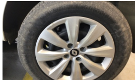
Jant kapağı seti > Çizik