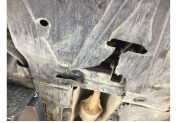
Motor, Alt muhafaza > Hasarlı