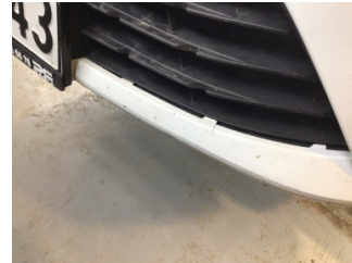
Tampon, ön, Spoiler > Ayarsız