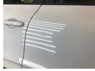
Kapı, sol arka, Kapı, sol arka > Ezik