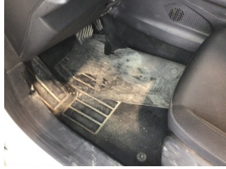
Taban, Taban halısı > Kirlenmiş