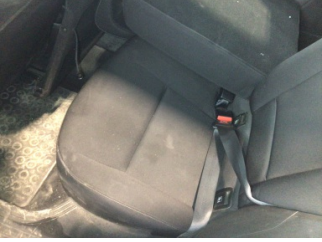
Koltuklar, arka, Arka koltuk > Kirlenmiş