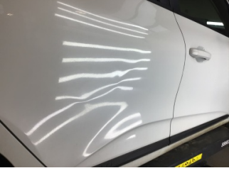
Kapı, sağ arka, Kapı, sağ arka > Ezik