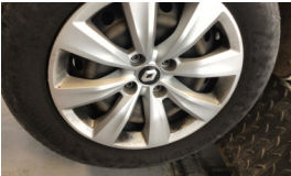
Jant kapağı seti > Çizik