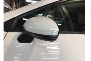
Dikiz aynası, sol, Dış dikiz aynası > Çizik