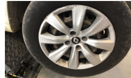
Jant kapağı seti > Çizik