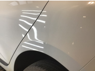
Çamurluk, sol arka, Çamurluk, sol arka > Noktasal Ezik