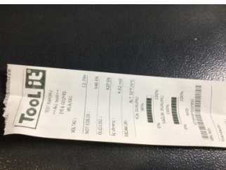
Elektrik donanımı/Pano, Akü > Test Sonucu