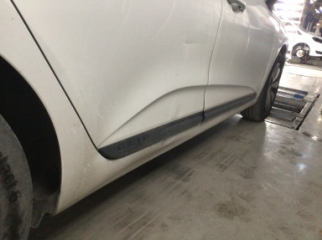
Kapı, sağ arka, Kapı bandı > Çizik