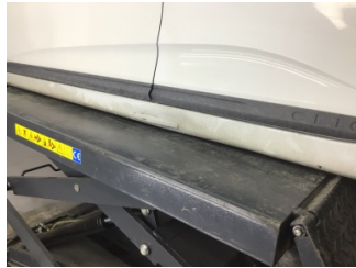
Marşbiyel, sol, Marşbiyel, sol > Hasarlı