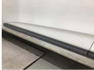
Kapı, sol ön, Kapı bandı > Çizik