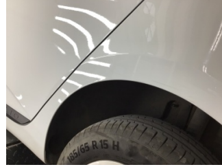
Çamurluk, sol arka, Çamurluk, sol arka > Çizik