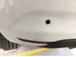
Tampon, arka, Park sensörü, sol > Hasarlı