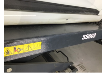
Marşbiyel, sağ, Marşbiyel, sağ > Hasarlı