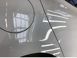
Çamurluk, sağ arka, Çamurluk, sağ arka > Çizik