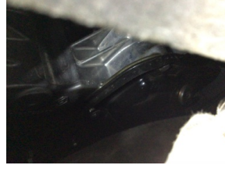
Motor, Yağ karteri contası > Yağ Kaçağı