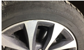
Jant, sol ön > Çizik