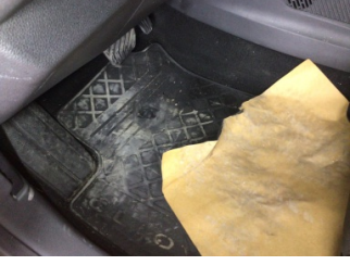
Taban, Paspaslar > Hasarlı