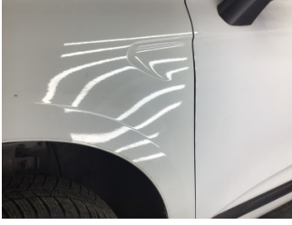
Çamurluk, sol, Çamurluk, sol > Noktasal Ezik