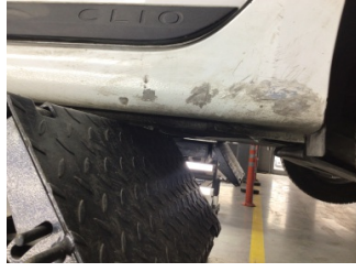
Marşbiyel, sol, Marşbiyel, sol > Boyası Atmış