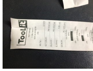
Elektrik donanımı/Pano, Akü > Test Sonucu