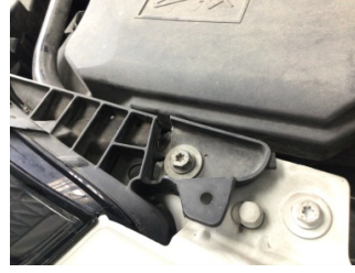
Farlar, Far, sol > Standart Dışı Onarım