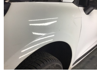
Çamurluk, sol, Çamurluk, sol > Noktasal Ezik