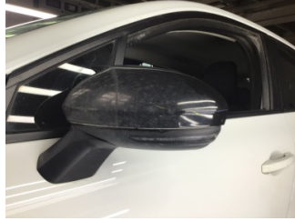
Dikiz aynası, sol, Dış dikiz aynası > Çizik