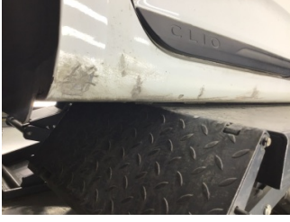
Marşbiyel, sağ, Marşbiyel, sağ > Boyası Atmış