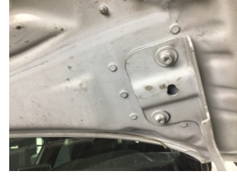
Motor kaputu, Mentеше > Ayarsız