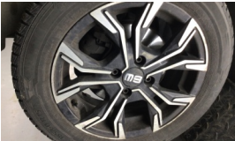
Jant, sol ön > Çizik