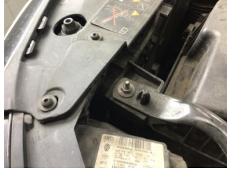
Farlar, Far, sol > Standart Dışı Onarım