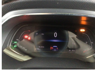
Motor, Bakım > Uyarı Lambası Yanıyor