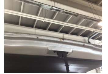
Bagaj kapağı/kapısı, Bagaj kapısı > Pas