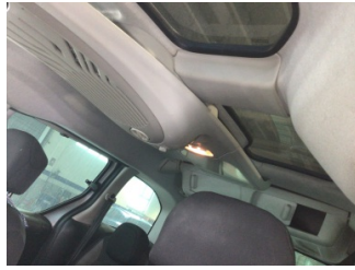
Döşemeler/Kapaklar, Tavan döşemesi > Kirlenmiş