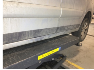
Marşbiyel, sol, Marşbiyel, sol > Hasarlı