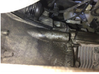
Şanzıman, Şanzıman > Yağ Kaçağı

Sayfa: 9/10 Araç Çıkış Tarihi: 03.02.2025 12:11