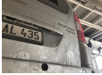
Bagaj kapağı/kapısı, Bagaj kapısı > Hasarlı