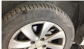
Jant, sol arka > Çizik