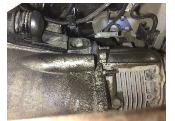
Şanzıman, Şanzıman > Yağ Kaçağı