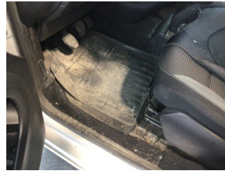
Taban, Taban halısı > Kirlenmiş