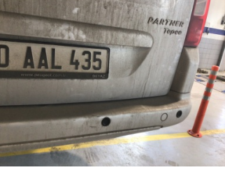
Bagaj kapağı/kapısı, Bagaj kapısı > Ezik