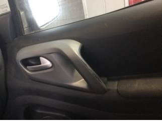
Döşemeler/Kapaklar, Kapı döşemesi, sağ ön > Deforme Olmuş