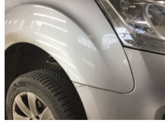
Çamurluk, sağ, Çamurluk, sağ > Noktasal Ezik