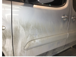
Kapı, sol ön, Kapı, sol ön > Çizik