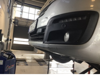
Tampon, ön, Ön tampon ızgarası > Çizik