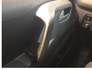
Döşemeler/Kapaklar, Kapı döşemesi, sol ön > Deforme Olmuş