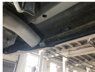
Tampon, arka, Bağlantı ayağı > Hasarlı