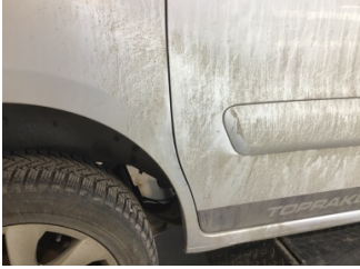
Kapı, sağ arka, Kapı, sağ arka > Hasarlı