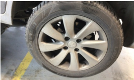
Jant, sol ön > Çizik