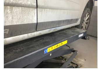
Marşbiyel, sağ, Marşbiyel, sağ > Hasarlı