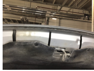
Motor kaputu, Motor kaputu > Pas