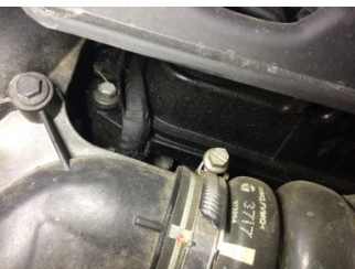
Motor, Motor üst kapağı, plastik > Yağ Kaçağı