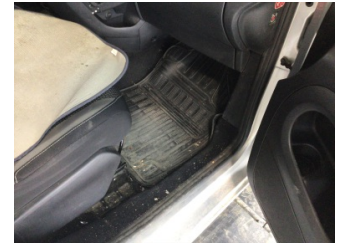
Taban, Taban halısı > Kirlenmiş