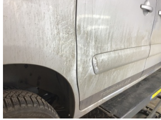
Çamurluk, sağ arka, Çamurluk, sağ arka > Hasarlı