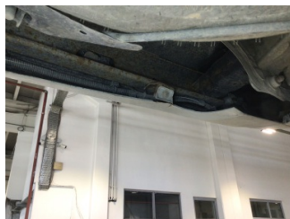
Tampon, arka, Bağlantı ayağı > Hasarlı