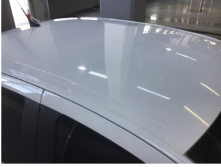
Tavan, Tavan > Yakıcı Madde İle Zarar Görmüş