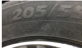
Lastik, ön > Hasarlı