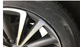
Jant, sol arka > Çizik