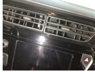
Kalorifer/Klima, Havalandırma ızgarası > Hasarlı