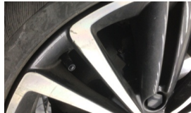
Jant, sol ön > Çizik