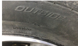
Lastik, ön > Hasarlı