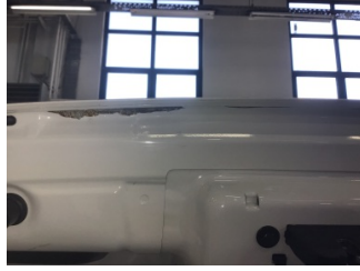
Bagaj kapağı/kapısı, Bagaj kapısı > Pas