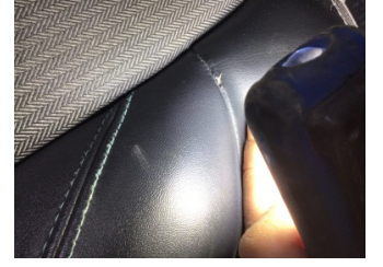
Koltuklar, ön, Koltuk, sol ön > Deforme Olmuş