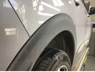
Çamurluk, sağ arka, Çamurluk ağzı > Çizik