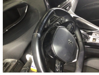
Direksiyon sistemi, Direksiyon simidi > Deforme Olmuş