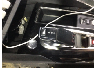
Şanzıman, Vites topuzu > Deforme Olmuş