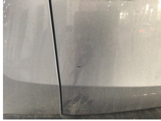
Bagaj kapağı/kapısı, Bagaj kapısı > Çizik