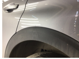
Çamurluk, sol arka, Çamurluk, sol arka > Noktasal Ezik