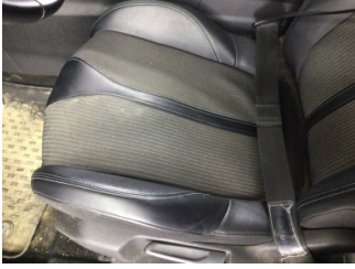
Koltuklar, ön, Koltuk, sol ön > Kirlenmiş