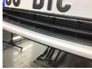
Tampon, ön, Ön tampon izgarası > Hasarlı