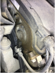
Motor, Motor üst kapağı, plastik > Yağ Kaçağı