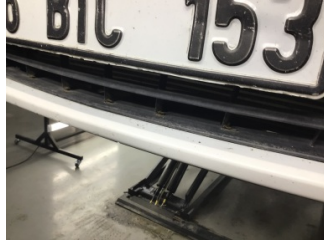
Tampon, ön, Ön tampon izgarası > Hasarlı