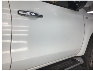
Kapı, sağ ön, Kapı, sağ ön > Noktasal Ezik