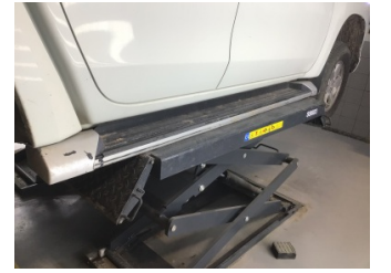
Marşbiyel, sağ, Marşbiyel plastiği, sağ > Boyası Atmış