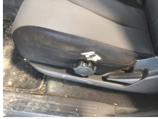
Koltuklar, ön, Koltuk, sol ön > Deforme Olmuş