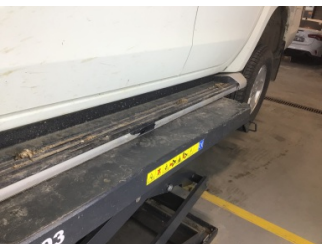
Marşbiyel, sol, Marşbiyel plastiği, sol > Boyası Atmış