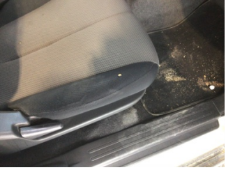
Koltuklar, ön, Koltuk, sağ ön > Deforme Olmuş