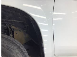
Çamurluk, sol, Çamurluk, sol > Çizik