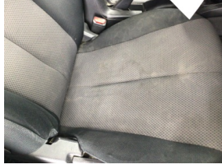
Koltuklar, ön, Koltuk, sağ ön > Kirlenmiş