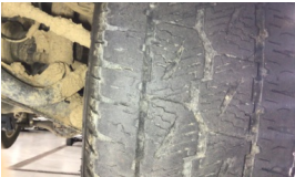
Lastik, ön > Deforme Olmuş