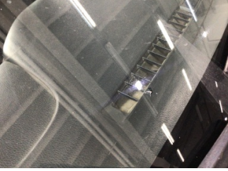
Camlar, Ön cam > Hasarlı