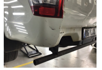
Çamurluk, sol arka, Çamurluk, sol arka > Ezik