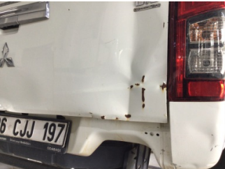
Bagaj kapağı/kapısı, Bagaj kapısı > Hasarlı