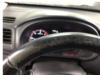
Direksiyon sistemi, Direksiyon simidi > Deforme Olmuş