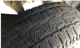
Lastik, arka > Deforme Olmuş