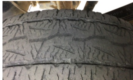
Lastik, arka > Deforme Olmuş