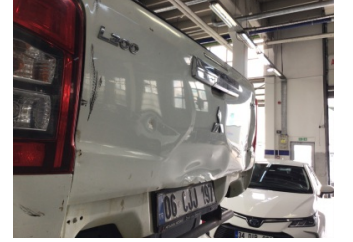
Bagaj kapağı/kapısı, Bagaj kapısı > Hasarlı