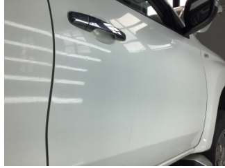
Kapı, sağ ön, Kapı, sağ ön > Çizik