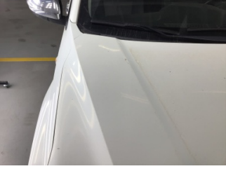
Motor kaputu, Motor kaputu > Ezik