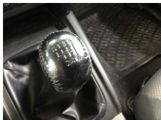
Şanzıman, Vites topuzu > Deforme Olmuş