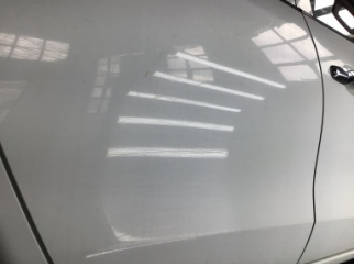
Kapı, sağ arka, Kapı, sağ arka > Çizik