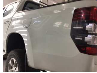
Çamurluk, sol arka, Çamurluk, sol arka > Çizik