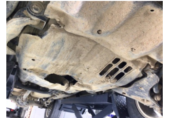
Motor, Alt muhafaza > Hasarlı