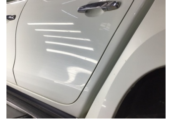
Kapı, sol arka, Kapı, sol arka > Çizik