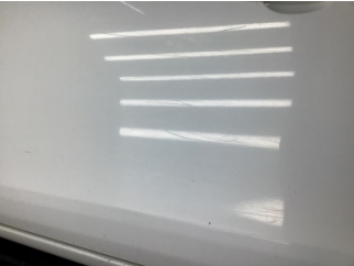
Kapı, sol ön, Kapı, sol ön > Çizik