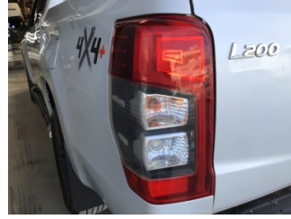
Arka lambalar, Arka lamba camı, sol > Hasarlı