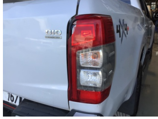
Arka lambalar, Arka lambalar, sağ > Hasarlı