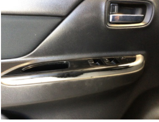
Döşemeler/Kapaklar, Döşemeler/Kapaklar > Deforme Olmuş