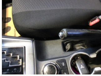
Döşemeler/Kapaklar, Döşemeler/Kapaklar > Deforme Olmuş