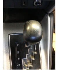
Şanzıman, Vites topuzu > Deforme Olmuş