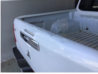
Bagaj kapağı/kapısı, Bagaj kapısı > Hasarlı