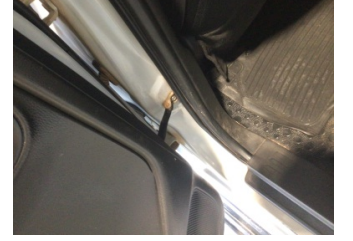
Kapı, sol arka, Kapı gergisi > Ses Yapıyor