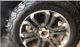
Jant, sağ ön > Çizik