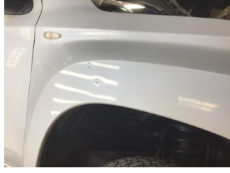
Çamurluk, sağ, Çamurluk, sağ > Ezik