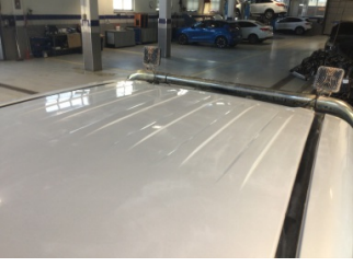
Tavan, Tavan > Ezik