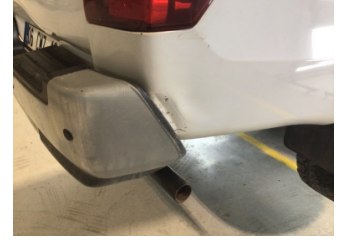
Çamurluk, sağ arka, Çamurluk, sağ arka > Ezik