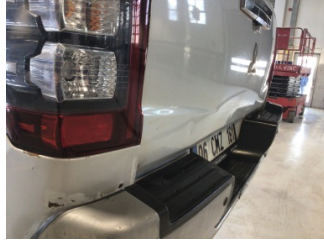
Bagaj kapağı/kapısı, Bagaj kapısı > Ezik