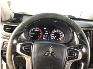
Direksiyon sistemi, Direksiyon simidi > Deforme Olmuş