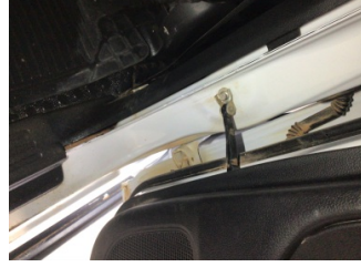
Kapı, sağ arka, Kapı gergisi > Ses Yapıyor