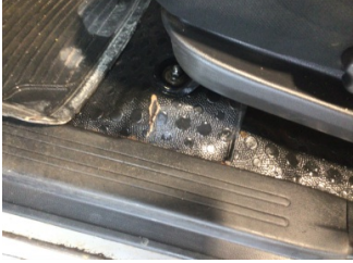
Taban, Taban halısı > Deforme Olmuş