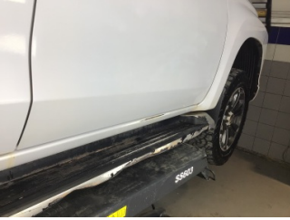
Marşbiyel, sağ, Marşbiyel, sağ > Çizik