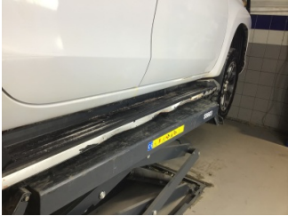
Marşbiyel, sağ, Marşbiyel plastiği, sağ > Hasarlı