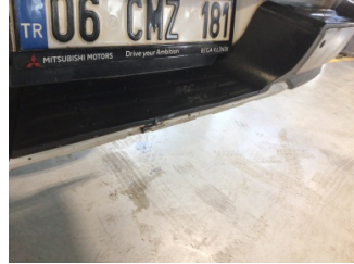
Tampon, arka, Arka tampon > Hasarlı