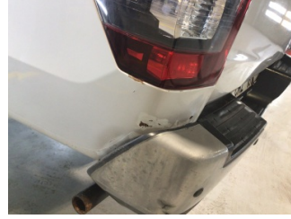
Çamurluk, sol arka, Çamurluk, sol arka > Ezik