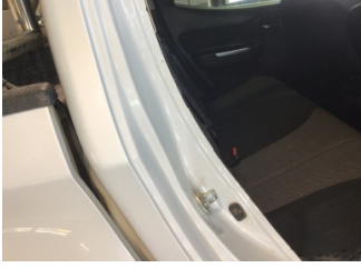
Kapı, sağ arka, Kapı fitili > Sökülmüş-Yok

Sayfa: 10/12 Araç Çıkış Tarihi: 02.01.2025 14:15