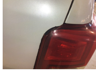
Arka lambalar, Arka lambalar, sağ > Hasarlı