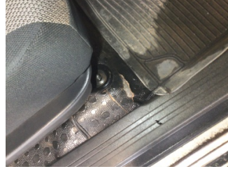
Taban, Taban halısı > Deforme Olmuş