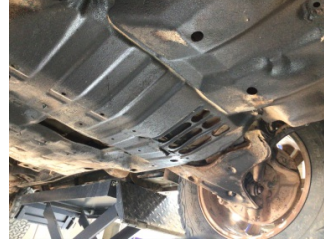
Motor, Alt muhafaza > Hasarlı