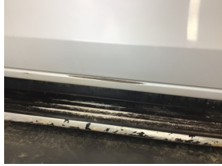
Marşbiyel, sol, Marşbiyel, sol > Çizik