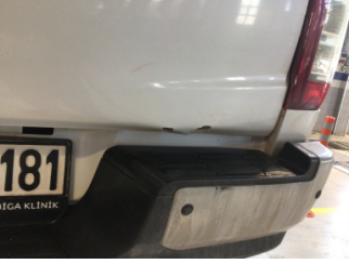
Bagaj kapağı/kapısı, Bagaj kapısı > Ezik