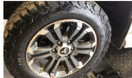
Jant, sol ön > Çizik