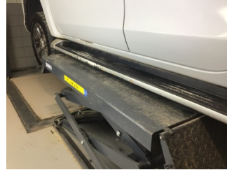
Marşbiyel, sol, Marşbiyel plastiği, sol > Hasarlı