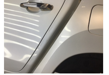
Kaporta, C-direk, sol > Ezik