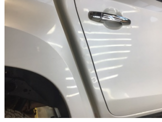
Kaporta, D-direk, sağ > Ezik