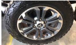
Jant, sol arka > Çizik