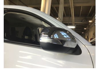
Dikiz aynası, sağ, Dış dikiz aynası > Deforme Olmuş