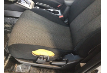
Koltuklar, ön, Koltuk, sol ön > Hasarlı